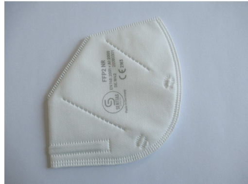
55268558002 Sentias FFP2 NR Maske - Fleece