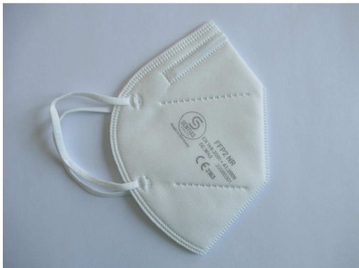
55268558005 Sentias FFP2 NR Maske