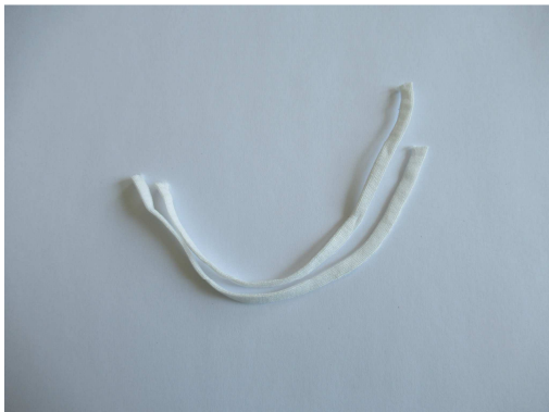
55268558003 Sentias FFP2 NR Maske - Gummiband